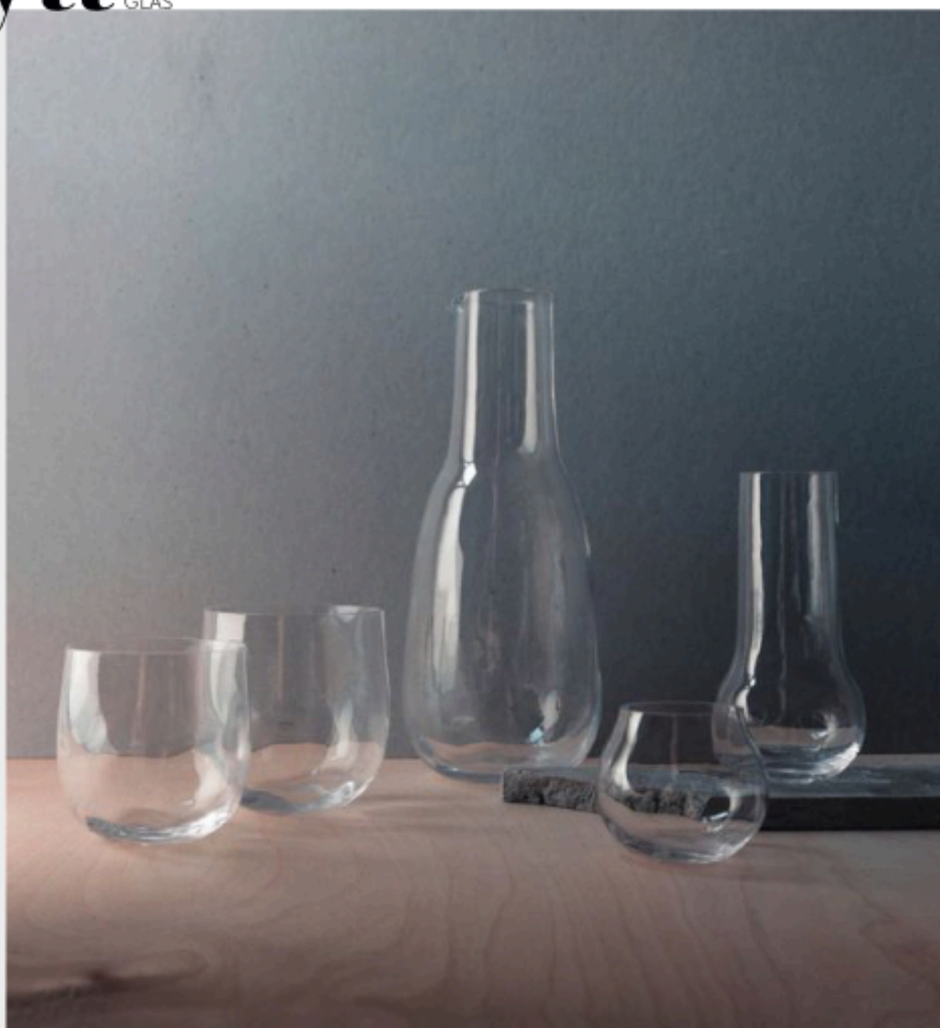
Simon Klenells glasservis för restaurang Oxenstiernan/ Subjective form. Glas 460-630,-, karaff 780,-.