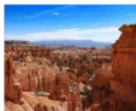
Höstens häftigaste rådyver.

DET HAR kommit en ny tågresä till. Kanadensiska tågbolaget Rocky Mountaineer meddelade i veckan att man i höst utökar sitt utbud av episka naturresor med Rockies to the Red Rocks – ett tvådagarsäventyr genom amerikanska delstaterna Colorados och Utahs karga landskap, känt för sina säregna kanjoner, röda klippformationer och naturliga stenbroar. Resan går mellan städerna Denver och Moab, med övernattnig i Glenwood Springs, och dagarna tillbringas i inglasade panoramavagnar så att resenärer inte ska missa en enda scenisk vy. Till detta erbjuds lokal cuisine och kunniga guider som berättar om traktens historia. Som vanligt när det gäller Rocky Mountaineer finns möjligheten att skräddarsy sitt resepaket med val av boende och aktiviteter före och efter tågresan. rockymountaineer.com